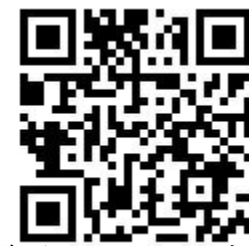
嘉義縣志願服務推廣中心 QR CODE