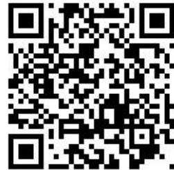
衛生福利部志願服務系統 QR CODE